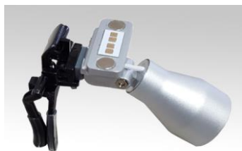
Рис.4.3 Крепление осветителя к универсальному