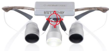
Рис.5.1 – 5.2 Осветитель в сборе на оправе бинокляров.

5. Отрегулируйте угол направления света, чтобы луч света был виден через линзы.