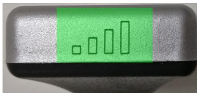
Рис.3.2 Аккумулятор – вид сбоку

Управление аккумулятором - включение и выключение источника света. Эта функция управляется касанием области, отмеченной зеленым на рисунке 3.1