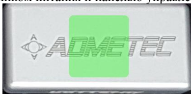
Рис.3.1 Аккумулятор – вид сверху

Каждый комплект Butterfly включает в себя 3 аккумулятора, служащих источником питания и панелью управления для осветителя.