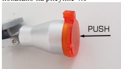
Рис.4.1 Внешний оранжевый фильтр

1. Установите внешний оранжевый фильтр на переднюю часть осветителя, надвинув наружное кольцо фильтра на переднюю часть источника света, как показано на рисунке 4.1