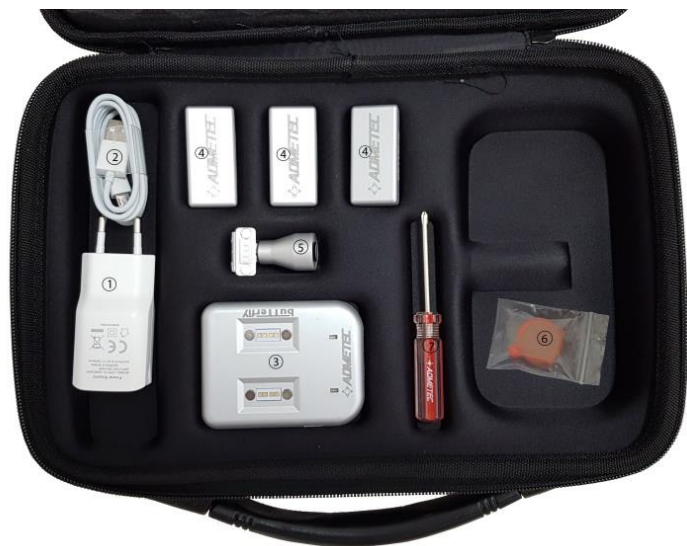
Рисунок 1: Комплект осветителя Butterfly