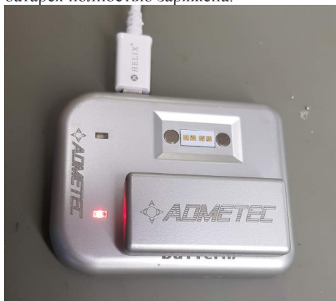
Рисунок 2: Зарядка аккумулятора

Индикатор зарядки загорится красным. Индикатор изменит цвет на зеленый, когда батарея полностью заряжена.